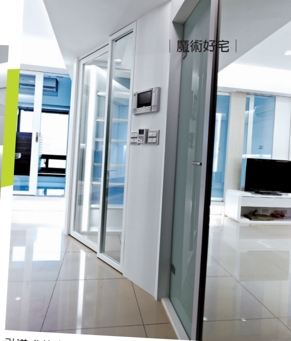
引導式的玄關既不會讓人一進門就看到客廳，又不會顯得過於封閉，流暢的動線一氣呵成，通道旁的牆面選擇使用鏡子覆蓋，以放大視覺空間與增加現代感。