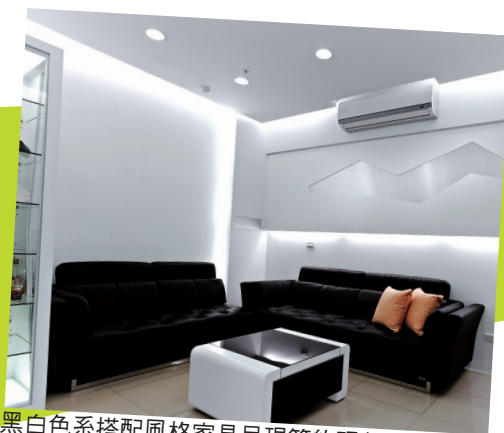
黑白色系搭配風格家具呈現簡約現代感。