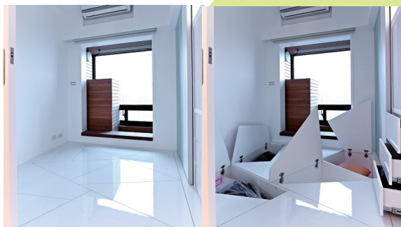
胡來順運用創意巧思在有限的坪數中充分發揮最大坪效，居室邊角也能被利用得淋漓盡致。