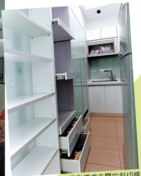
緊鄰玄關的廚房也因引導式玄關的斜切線條使得空間變大。